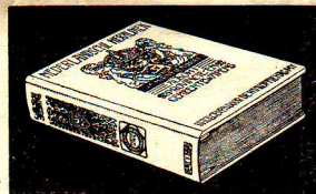
Luxe-omslag met schroefsluiting.

kunnen alle albumbladen voor gemeentewapens uitgave 1925 tot 1928 worden opgeborgen. Oud-verzamelaars, die reeds een kleinen omslag (vroegere uitgave) bezitten, kunnen een tweeden omslag van hetzelfde model betrekken à f 1.10.