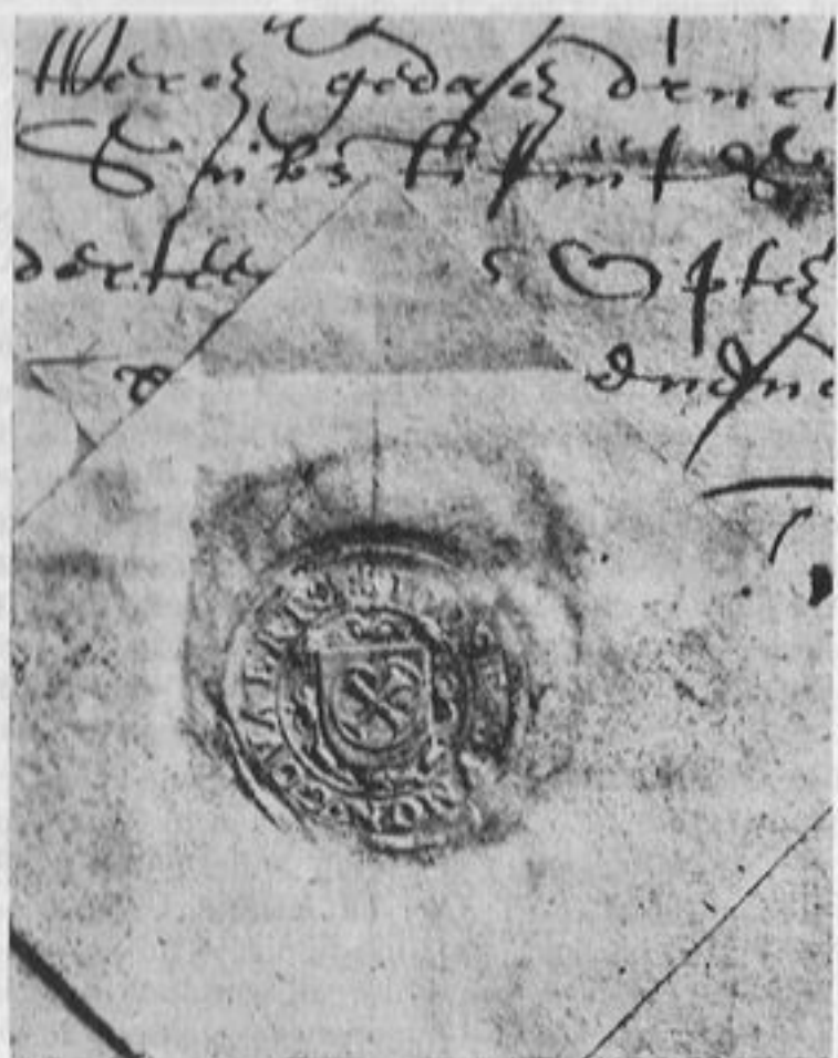
Schepenzegel van Joost Symon Goderts 1639

JOOST SYMON GODERTS werd in 1637 op de voordracht geplaatst voor de benoeming tot schepen van Dongen, met de aanbeveling „wesende den swaeger van PEETER SIJMONS" (VAN SON) en werd benoemd (10) . Zijn schepenzegel is gedrukt op een schepenacte van Dongen dd. 14 Mei 1639 (11) . Met het zelfde wapen zegelde zijn vader SYMON GODERT SYMONS als schepen van Dongen 6 September 1612 (12) .